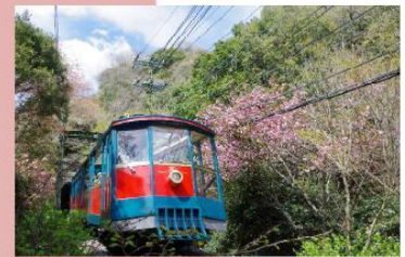
協力：六甲山観光株式会社