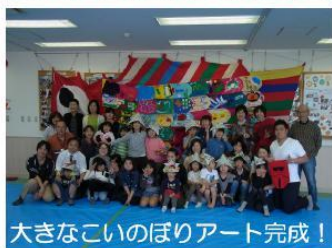
大きなこいのぼりアート完成!