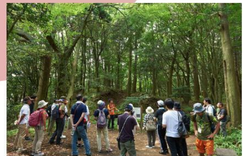
協力：摩耶山再生の会・灘百選の会

申し込んでもなかなか予約できないほどの人気です。 鶴甲の貸し切りデーです。是非この機会に参加しましょう。