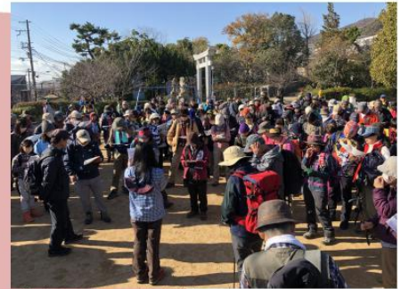
集合・スタート風景