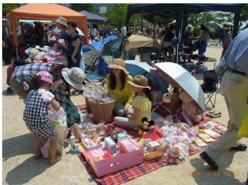
ガレージセール & チャリティーバザー