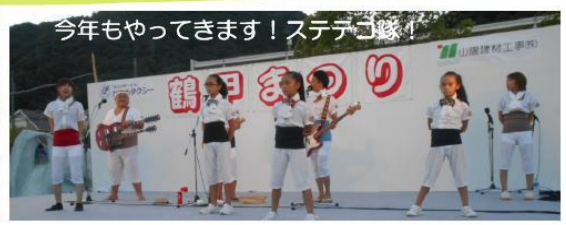
今年もやってきます！ステテコ隊！