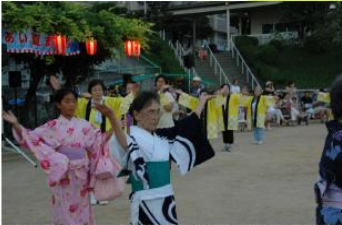
前夜祭は盆踊りで盛り上がりましょう！

9月1日(土) 鶴甲まつり前夜祭 盆踊り・コンサート 9月2日(日) 会場：鶴甲北公園 鶴甲まつり 今年は「ステテコファッションコンテスト」を計画します！