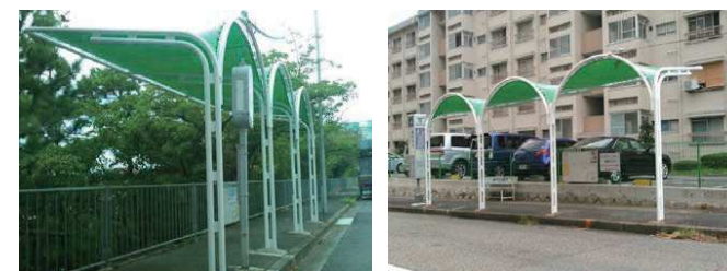
市バス停留所がきれいになりました