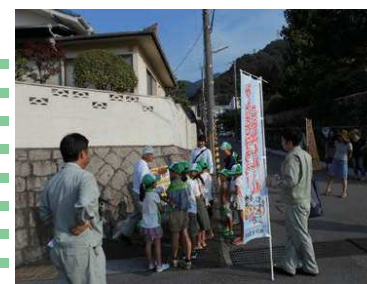
ワケトンサポーター