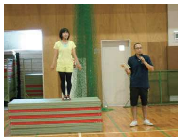
ラジオ体操講習会