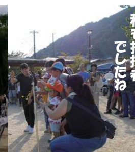
私も指揮者！ でしたの