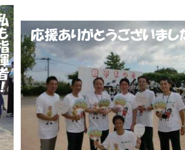
応援ありがとうございました