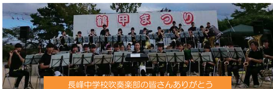
長峰中学校吹奏楽部の皆さんありがとう