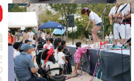
応援ありがとうございました