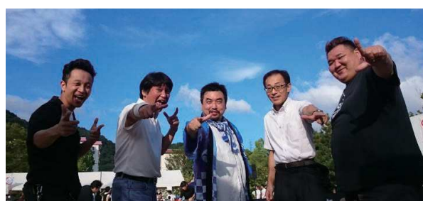
ステテコ隊からのメッセージ